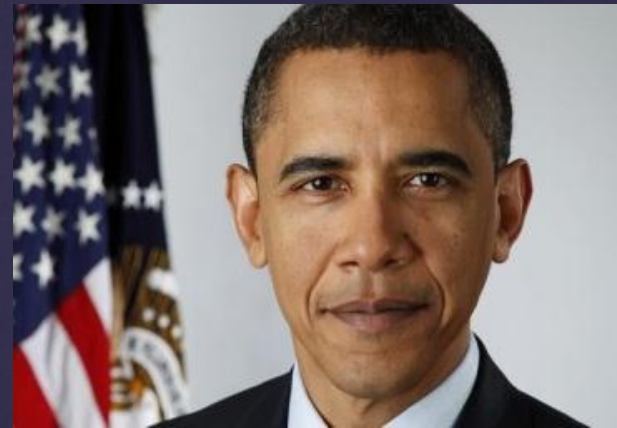
Barack Obama – Demócrata

⌘ Pero lo único que afecta el comportamiento del mercado no es el tema de la continuidad. Algunas de las políticas y propuestas de los candidatos podrían tener un impacto importante sobre la economía.