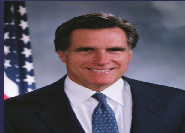
Mitt Romney – Republicano